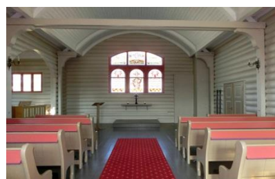
Åmot Kapell 1916 Sitteplasser ca 140