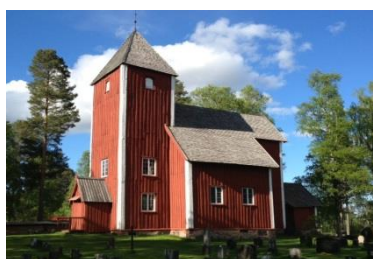
Nordre Osen gamle kirke 1777. Sitteplasser ca 100