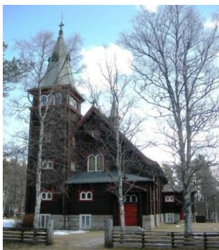
Nordre Osen kirke 1923