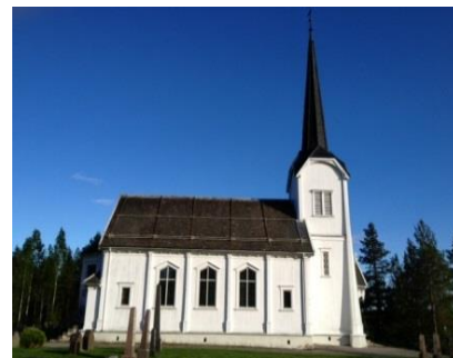
Deset kirke 1867