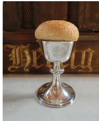
Nattverdkalk og et helt brød til nattverdbruk, i Nordre Osen kirke.

Vi har altså alterringen, forrest i kirken, ved alteret, og de fleste kirker i Norge har en slik. Det var meningen da kirkene ble bygget, at man skulle knele side ved side på denne ringen, mens man fikk utdelt brød og vin av presten. Den er ikke så ofte i bruk lenger, nettopp fordi terskelen for å gå til nattverd da blir høy for mange.