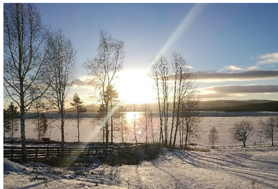
Vinterstemning ved Osensjøen.