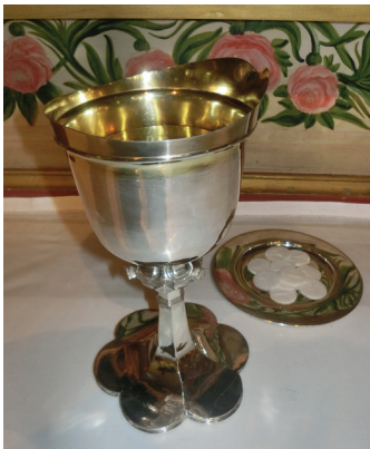
Kalk og disk i Åmot kirke.

De to sentrale gjenstandene i nattverden er altså kalk og disk, litt stiliserte ord for beger og tallerken. Det viktige er naturligvis det som er oppi begeret og på tallerken, det er det som kalles "hostier", nattverdselementene.