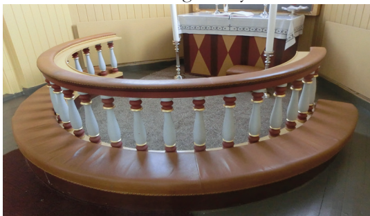
Alterringen i Deset kirke.

I noen moderne kirker er alterringen plassert i midten av kirkerommet, og en del steder har den form som en firkant heller enn en ring, men i det store flertallet av kirker er den en halvsirkel, formet rundt alteret. En ide knyttet til dette, er at den halve sirkelen også har en annen halvpart, som er “i det hinsidige”, og hvor folk som har gått bort, helgener, også deltar i måltidet, sammen med de levende; dette peker også mot den kristne tenkningen om døden; - de døde slutter ikke å eksistere, men de er hos Gud, på et sted utenfor vår fatteevne og vårt synsfelt.